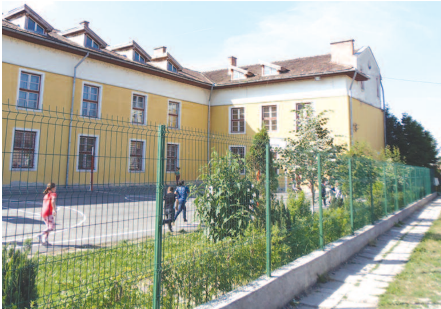
Marosszentannai Népusáság a 6. oldalán